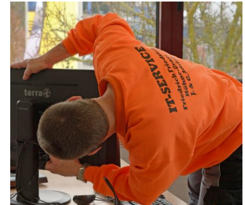
4. Fachkundige Neuinstallation am Zielort

Mehrere hundert Arbeitsplätze ziehen die Profis des IT-Umzugsteams innerhalb kurzer Zeiträume problemlos um.