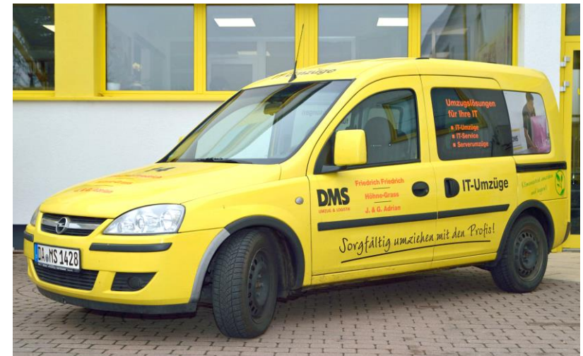
IT-Service-Fahrzeuge ergänzen unseren Fuhrpark