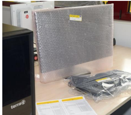
2. Lückenlose Dokumentation und Markierung zur zuverlässigen Zuordnung