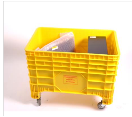
3. Sicherer Transport in stoßfesten PC-Wannen und luftgedephten Fahrzeugen