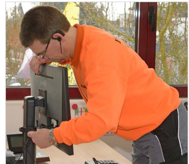
1:1 Aufbau am Zielort inkl. Funktionsüberprüfung und IT-Protokollierung