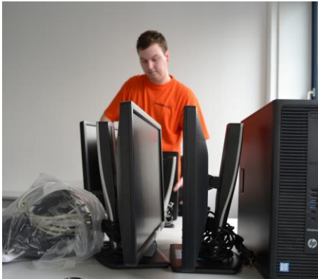
1. Verpackung aller PC-Komponenten und empfindlichen Teile